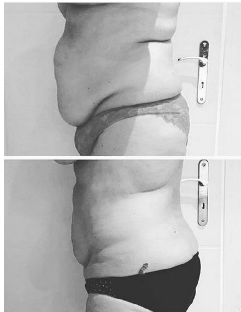
4 séances : 3 graisse over 50 + 1 excès de peau Au doux passage • HOULDIZY