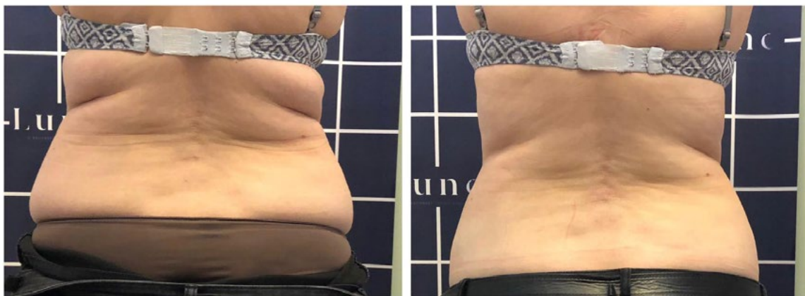
1 séance Graisse over 50