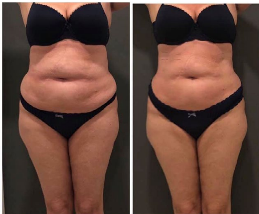
1 séance Graisse over 50 Cryostretto • MEERHOUT