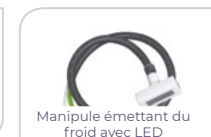
Manipule émettant du froid avec LED