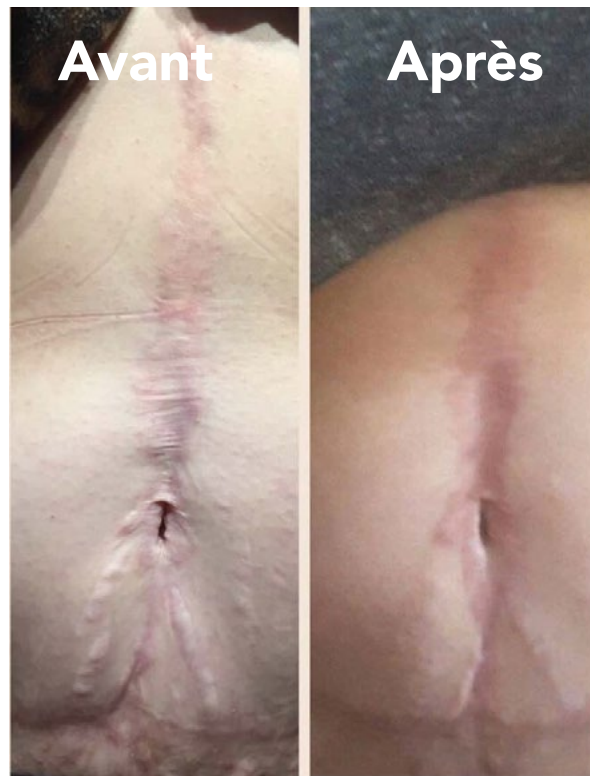
Après 1 séance Cicatrices

Durée de traitement en fonction du type de peau et de l'âge du client