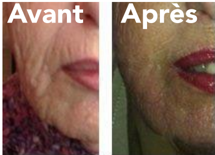
Après 3 séances Rides labiales

Durée de traitement en fonction du type de peau et de l'âge du client